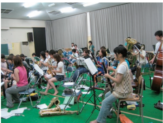
夏に行われた合宿

ただ、やはりこれだけの人数で活動しているの、当然意見のすれ違いや衝突も時にはあります。しかし、それは「良いサークルを作ろう、楽しもう」という意志があるからこそであり、その結果目標に到達できた時の喜びはとて大きなものとなります。ゆるぎない意志を持つていれば、たとえつらくても、また立ち上がる事ができると信じています。そ