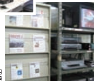
教材制作用編集機器