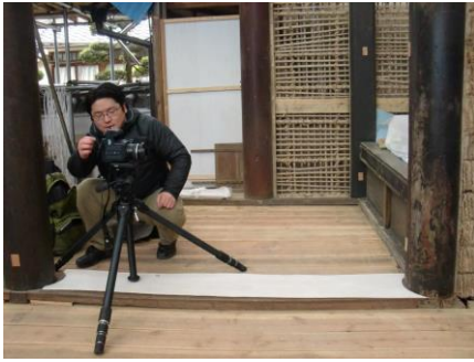
重要文化財・長福寺本堂内の柱に描かれた迦陵頻伽図の赤外線撮影調査 (長福寺は、奈良県生駒市俣口町に位置する真言律宗の寺院)

X線や赤外線、紫外線などの電磁波を利用して、文化財の材質や技法、構造などの調査研究に取り組んでいます。長い年月を経て現在まで遺されてきた文化財は、その多くが経年劣化によって制作当時とは異なった状態となっています。例えば、寺院の中に描かれている室内彩色画は様々な要因によって褪色や黒色化が生じてしまっているものが数多くあります。貴重な文化財を未来に継承するためには、それが「どのような物質で作られ」、「どのような構造であり」、そして「どのような状態なのか」を明らかにする必要があります。