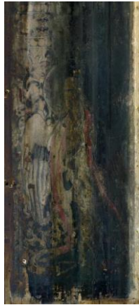
迦陵頻伽図の可視光写真 (撮影波長域：380-760nm)