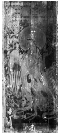
迦陵頻伽図の赤外線写真 (撮影波長域：780-1100nm)