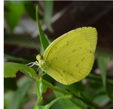
図1. キタキチョウの成虫

奈良教育大学では、この問題を解決するために昆虫類の生殖巣の凍結保存法を研究しています。幼虫から摘出した未熟な生殖巣を液体窒素で保存しておけば、凍結した卵巣や精巣を解凍後に別個体に移植することで、近交弱勢が起こる前の生殖巣由来の子を得ることができます。この技術は主にカイコなどの実験昆虫で開発されてきました。この技術をチョウ目（鱗翅目）の絶滅危惧種に応用し、生息域外保全を補完することを目指しています。