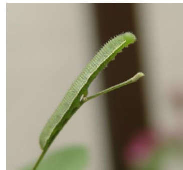
図2. キタキチョウの幼虫