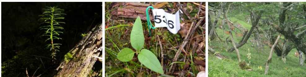
図2. シラビソの実生(左)、オオヤマレンゲの実生(中)、ニホンジカの群れ(右)。